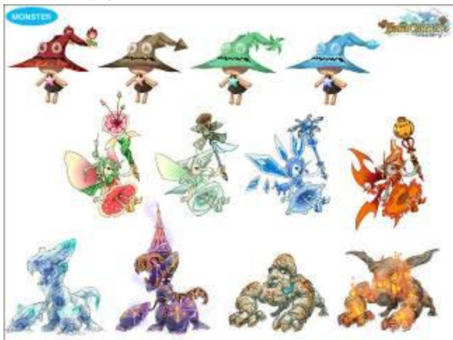
▲モンスターイメージ

当リリースでは、新しい情報として「ティアラ コンチェルト」の開発時に制作された、コンセプトアートを公開いたします。「ティアラ コンチェルト」のアートワークは開発元 Firedog Studio の Creative Planning Director、Aki Li 監修の元、制作されています。