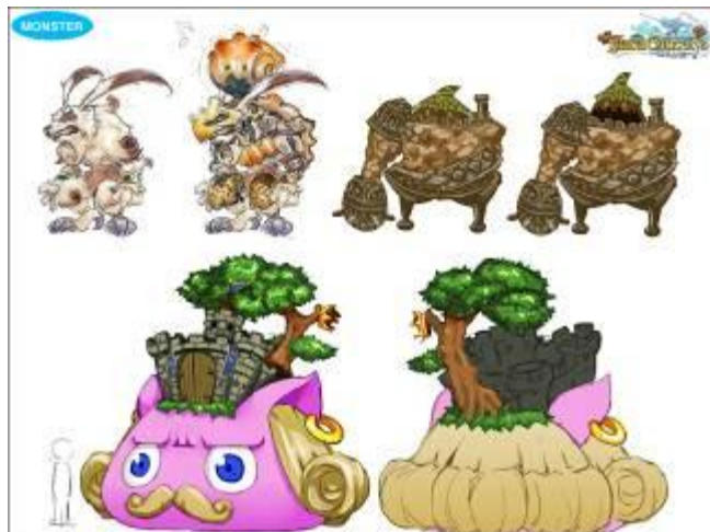
▲モンスターイメージ