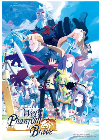
「Web ファントム・ブレイブ」

※「ファントム・ブレイブ」は、日本一ソフトウェア社によって 2004 年より発売された家庭用ゲームソフトです。