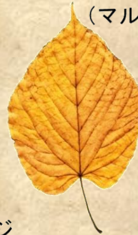
カエデらしからぬ葉の形 ヒトツバカエデ (マルバカエデ)