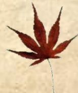
イロハモミジ ヤマモミジと併せ、もみじの 代表格