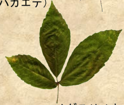
メグスリノキ とても美しいピンク色の紅葉