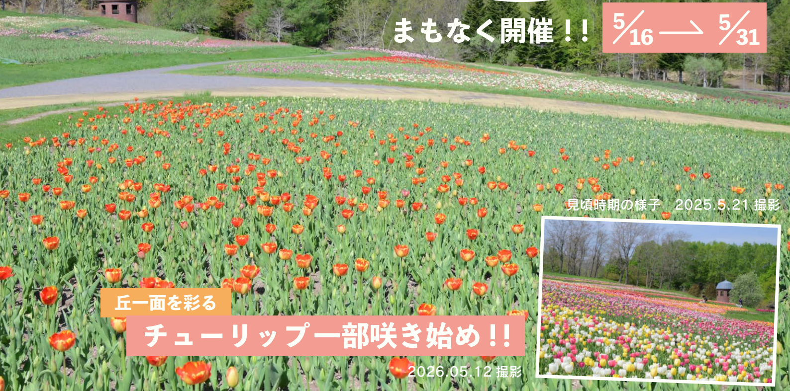
見頃時期の様子 2025.5.21 撮影