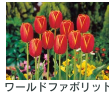
ワールドファボリット