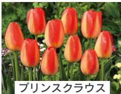
プリンスクラウス