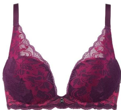
【新色】プラムパープル