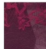
【新色】プラムパープル

胸元からストラップ上部にかけてレースを幅広に配し、華やかさと透け感を演出した大人のデザインです。カラーは艶やかで深みのあるプラムパープルが新登場。肌馴染みの良いベージュも引き続き展開します。