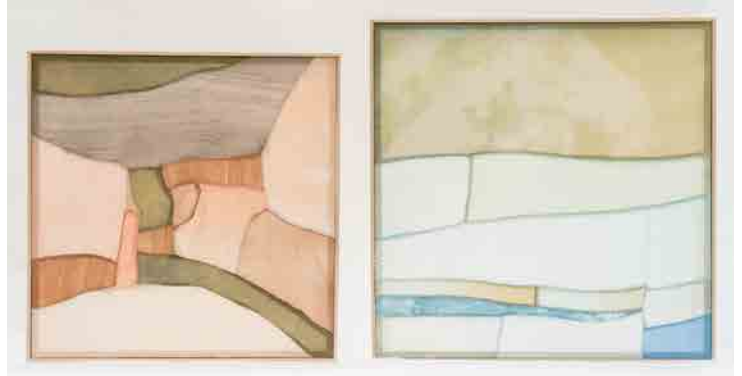
▶作品名：「Fragrance Scenery #1 #2」

今後、未来に向けて行うべき取り組みの一つとして SHIRO が考えたのは、アーティストとコラボレーションしたお手提げ袋の作成です。