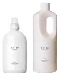
ランドリーリキッド/BIG