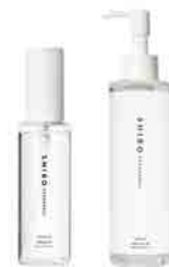
スプレー80 /ジェル80*4 ※ジェルの容器を変更予定