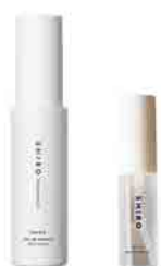
オードパルファン/ミニ