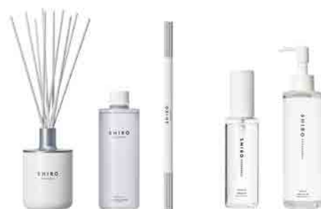
ルームフレグランス/レフィル ※名称、容器等を変更