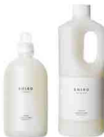
ファブリックソフナー/BIG