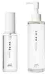
スプレー80 /ジェル80 *4

香り立ちを高めました。ホワイトトリリーのみ、一部成分 *12 を抜き、使用感を微調整しました。