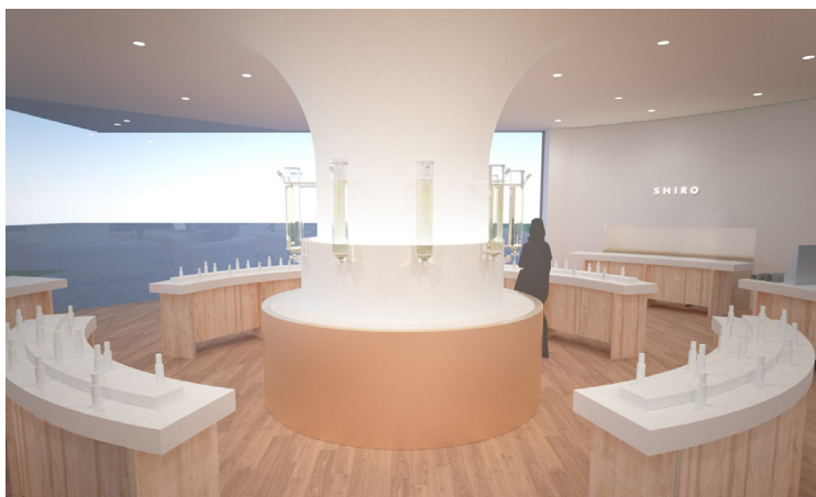
「みんなの工場」ショップ内 フレグランスバー（仮称）

2021年6月より、シロ創業の地である北海道砂川市で推進している「みんなのすながわプロジェクト」では、シロの工場と付帯施設が一体となった「みんなの工場」を建設中です。施設内に移転予定の「SHIRO 砂川本店」にはブランド初となるカスタムフレグランスをつくることのできる、フレグランスバー（仮称）の設置を予定。今回、鬼木さんにはフレグランスバー（仮称）を含むショップの空間デザインを手掛けていただいています。