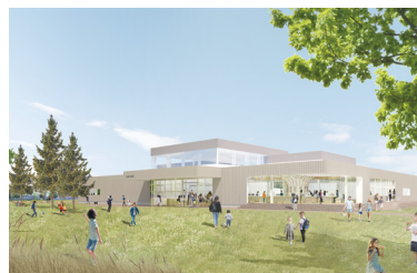
「みんなの工場」外観