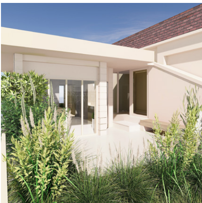
2階のテラスにあるお庭