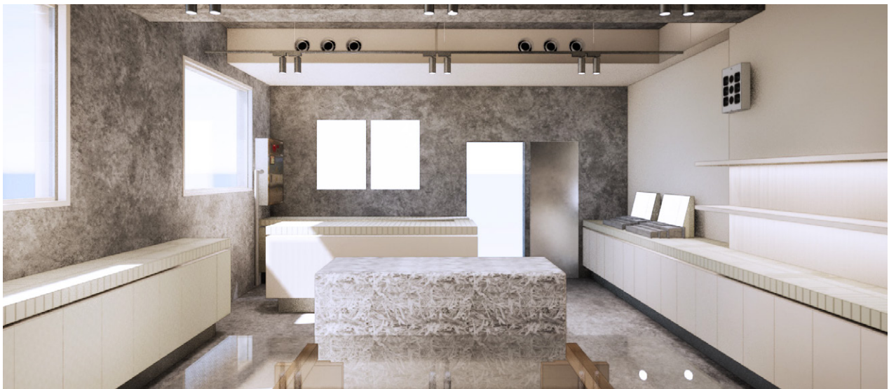
2階の店内 ガラステーブルの脚は木工所の作業台の脚を再利用しています。2階の壁にはお客様が自由に持ち帰ることができる“おでかけカード”を設置いたします。このカードには私たちのフィールドワークから、ご紹介したいソウルのスポットをたくさん集めました。「SHIRO Seongsu」がお客様と地域を繋いでいきます。

今回、この地にお店をオープンすることを決めたのは自らの足でフィールドワークし、聖水の歴史や文化の背景を知ったからです。聖水は2000年初頭まで工業地帯として発展しました。そのため建物は耐久性や耐火性を考慮したレンガ造りが多く、今もその建築スタイルが色濃く残っています。現在これらの建物はリノベーションされ、新しくカフェやショップに生まれ変わっています。また聖水は“ソウルのブルックリン”と呼ばれ、アート・カフェ・ファッションの街として現在、注目されています。