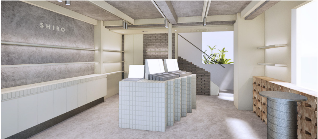
1階の店内 一番奥にある階段の側面のブロックと窓はそのまま以前のお店から引き継いでいます。エントランスのドアハンドルは、1階のメインのウィンドウガラスを粉砕してテラゾーに生まれ変わらせ、再びお客様をお迎えいたします。周りにある什器の天板のレンガは余剰在庫のものを譲り受けて活用しました。

店内はかつて靴製造工場だった歴史を尊重し その痕跡もそのまま活かすことで、廃棄を減らし循環を生む