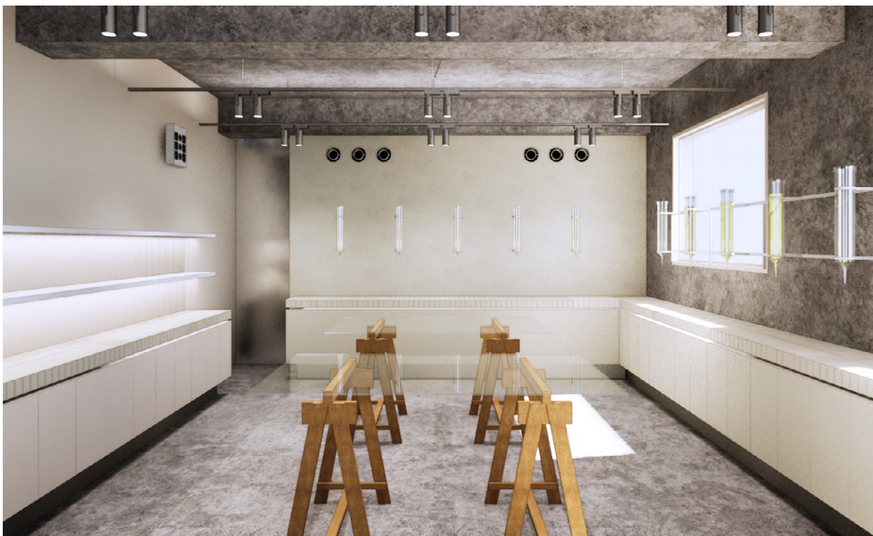
2階の店内に「ハーブブレンダーラボ」があり、ハーブを用いたフレグランスづくりが体験できる

また、私たちは韓国でも製品の原料を探す旅をしています。素晴らしい人と原料に出会ったら、新たな製品を皆さんへお届けする予定です。※状況によってサービスの詳細とスタート時期が変更になる場合がございます。