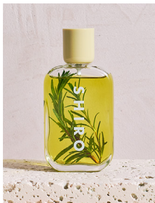
「ハーブブレンダーラボ」のフレグランスミスト 90mL 70,000ウォン