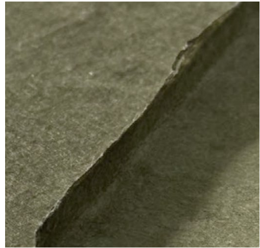
「槐(エンジュ)」の花の蕾を乾燥させた植物染料で染めた韓紙は、より一層の強度や防虫効果を生み出す。染めた直後は淡い色合いですが、時間とともに徐々に深い琥珀色へと変化していく美しさがある。

韓紙は別名「百紙(ペクジ)」とも呼ばれます。これには、1枚の韓紙が完成するまでに「職人が99回手をかけ、100回目に使う人の手へと渡る」という意味が込められています。原料である楮(コウゾ)の枝を切り出し、皮を剥ぎ、叩き、不純物を手作業で取り除く。気の遠くなるような前準備を完璧にこなして初めて、美しい白い紙が漉き上がります。彼らの仕事は、自然への敬意と、一切の妥協を許さない忍耐の結晶です。韓紙の製作過程には機械化が難しい領域が多く、今もなお人の手によって完成される工程が数多く存在します。単に紙をつくるのではなく、時間と感覚の積み重ねがあって初めて成し遂げられる仕事であることが、強く伝わってきます。今回私たちは、韓紙の紙漉きの工程に携わらせていただきました。繊維を手でちぎりながら重ねあわせ、紙の表面をならさず素材の特徴を際立たせるように仕上げました。紙そのものにも強度はありますが、さらに韓紙の保存性を高めるため染色を行います。「植物の命を紙に移す」という染め作業も、時間と職人の技の積み重ねで成り立ちます。こうしていくつもの工程を経て生まれた紙だからこそ、「一千年生き続ける紙」とも言われているのです。そんな染色韓紙を何枚もつなぎあわせ、什器の側面や扉に。美しさだけではなく実用的で強度ある素材として使用していきます。時代の移り変わりに対して、この文化が消えてしまわないよう、新たな用途を世の中に提案する機会となることを願っています。