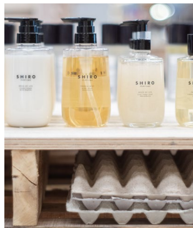
2025年12月11日(木)よりTHE HYUNDAI SEOULで1週間開催した「借りて返す、そして捨てない」お店づくりに挑戦したPOP UP STOREの仕器