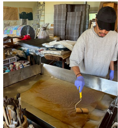
(左・中央)楮の枝を柔らかく蒸し上げ、冷めないうちに手作業で、丁寧に外皮を剥ぎます。真冬の寒い時期に行われることが多く、指先の力と根気が必要な作業。(右)晋州(チンジュ)の工房にて、韓紙を植物染料にて染めている様子