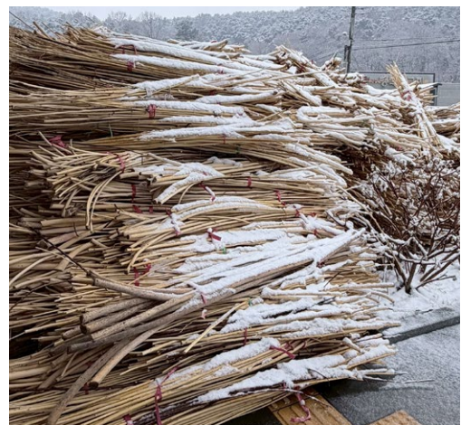
韓紙の原料となるクワ科の落葉低木「楮」の皮を削り、残された木芯。地元では、自然の恵みを無駄にせず、燃料として生活の中で循環されてきた素材。現在は、それでも余剰する分は産業廃棄物として処理される。

そしてそれらを、職人の手仕事へのオマージュとしてカウンター什器へと再生させます。自然の恵みを無駄にせず、生活の中で美しく循環させてきた韓国の伝統的な知恵。そして、SHIROのものづくりの考え方。その2つが国境を越えて美しく共鳴する、新店舗の空間をぜひご体感ください。