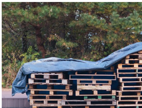
運搬用の木製パレット。ウルチロサムガの印刷団地の一角で壊れて路上に山積みになっていたもの

その記憶を坪村店へつなぎ、新しい歴史をつくる仕器として再利用いたします。「つくる責任」を考え、未来を見据えたお店づくりに、私たちは取り組み続けます。