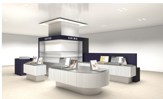
新店舗「SHIRO ジェイアール名古屋タカシマヤ店」

「SHIRO 北千住店」「SHIRO 玉川高島屋S・C店」など東京都内6店舗に加え、2022年12月にオープンした新店舗「SHIRO ジェイアール名古屋タカシマヤ店」のデザインを担当。北海道砂川市の新施設「みんなの工場」内に移転オープンする「SHIRO 砂川本店」では、ブランド初のフレグランスバーを含むショップの空間デザインを手がける。