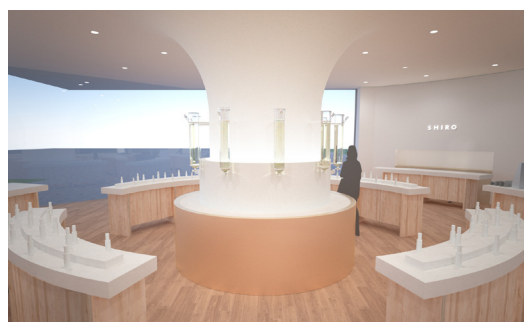
「みんなの工場」ショップ内 フレグランスバー(仮称)