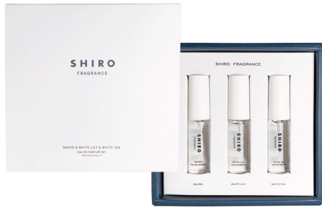
オードパルファンセット 10mL×3種 4,950円 (税込)