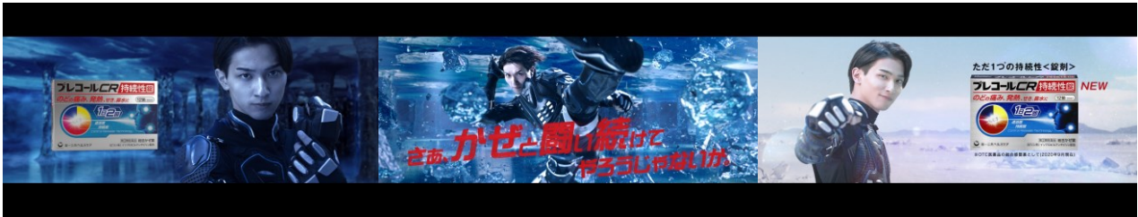
画像：TV-CM「プレコール 闘い続ける」篇より

つらいかぜと闘い続ける横浜さんの華麗なアクションシーンと、打ち勝ったあとの微笑む表情に注目です。