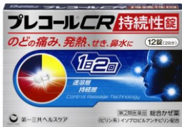
プレコールCR持続性錠 新発売 かぜの諸症状の緩和に