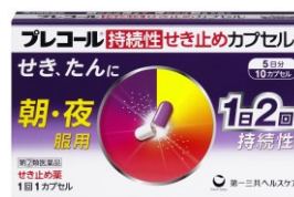
プレコール持続性せき止めカプセル せき、たんに