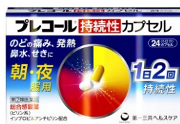
プレコール持続性カプセル かぜの諸症状の緩和に