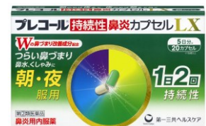
プレコール持続性鼻炎カプセルL X 鼻水、鼻づまり、くしゃみに