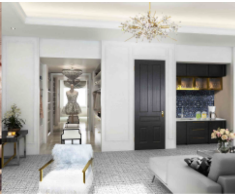
スイートルーム エレガント