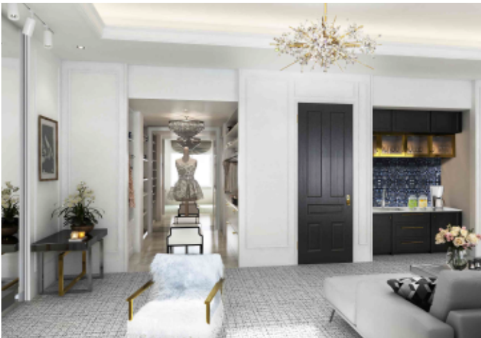
スイートルーム エレガント SUITE ROOM ELEGANT

客室数は全760室。大人の女性が洗練された上質な世界観に触れ、エネルギーが充足する喜びを表現するスイートルーム『エレガント』や、安らぎと優美な時を過ごす喜びを表現する客室など、様々な利用シーンに合わせた客室をご用意しています。