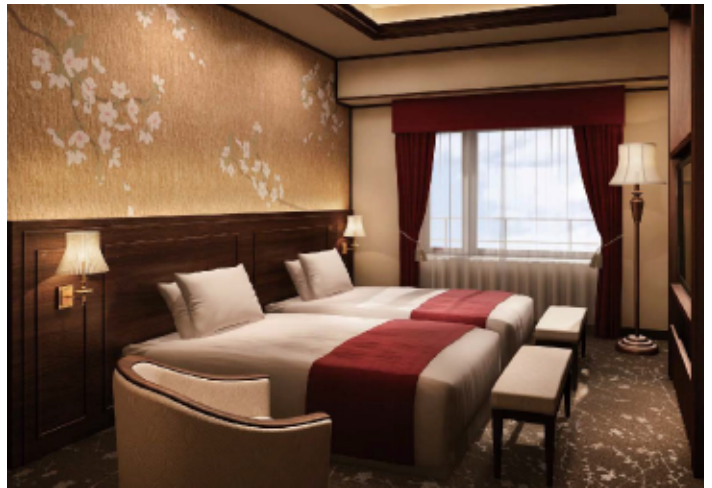
スイートルーム クラシカル SUITE ROOM CLASSICAL