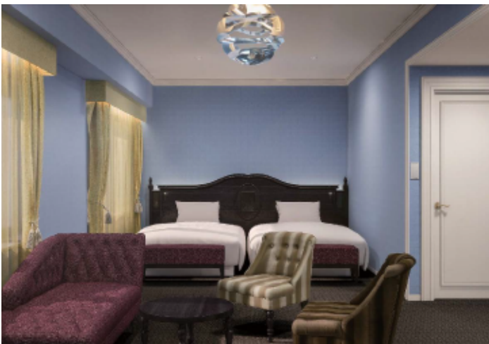
ラグジュアリーフロア グレイストwin LUXURY FLOOR GRACE TWIN