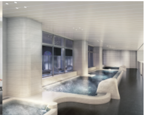
天然温泉の大浴場