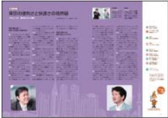
東京の便利さと快適さの境界線 巻頭インタビュー コラムニスト 泉麻人氏