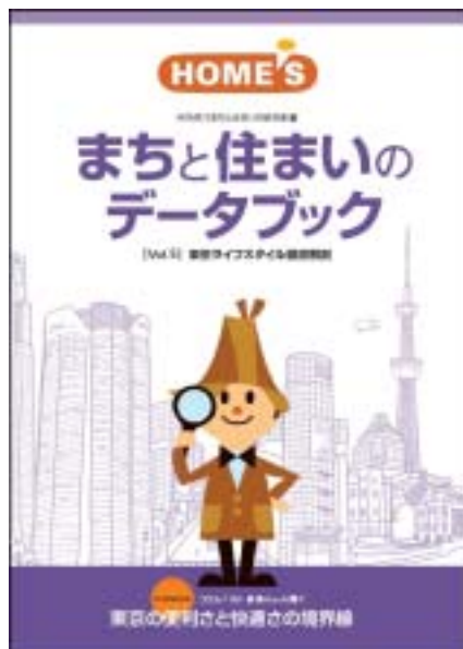
『HOME'S まちと住まいのデータブック【Vol.5】 東京ライフスタイル徹底解剖』 HOME'Sまちと住まいの研究室 編

住宅・不動産情報ポータルサイト「HOME'S」を運営する株式会社ネクスト(本社:東京都中央区、代表取締役社長:井上 高志、東証マザーズ:2120)は、このたび、2007年10月から2008年3月に実施した「まち」と「住まい」に関する意識調査ならびに不動産業界動向などをまとめた冊子、『HOME'S まちと住まいのデータブック【Vol.5】 東京ライフスタイル徹底解剖』(非売品)を発行いたしました。今回もご希望の方、先着300名様にプレゼントいたします。(お申し込みは専用WEBページ経由のみとさせていただきます)。