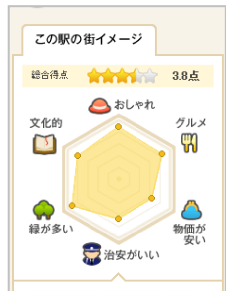
<住みやすさに関する6つの街イメージ>

「まちカラ！」という名前には、「街のカラーがわかる」「街のチカラがわかる」ユーザーによる投稿と、『HOME'S』、および弊社(株)ネクストが運営する地域コミュニティサイト「Lococom(ロココム)」に蓄積された地域情報によって「街のカラフルなコレクションを作り上げたい」という思いが込められています。