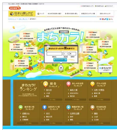
<トップ画面イメージ>

「まちカラ！」 http://www.homes.co.jp/contents/machikara/