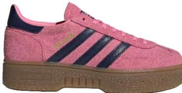
HANDBALL SPEZIAL BOLD W (IH9184) 自店販売価格 ¥ 16,500 (税込)