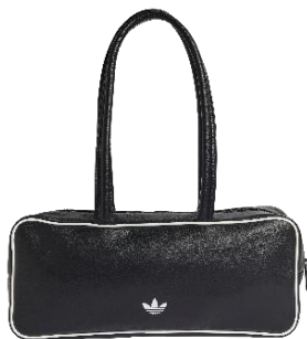
ADICOLOR AL (KD7851) 自店販売価格 ¥ 7,700 (税込)