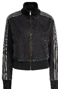
FIREBIRD TT D (KD2898) 自店販売価格 ¥ 15,400 (税込)