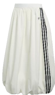
BALLOON L SK (KE3441) 自店販売価格 ¥ 13,200 (税込)