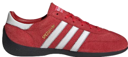
HANDBALL SPEZIAL LO PRO W (KJ3626) 自店販売価格 ¥ 15,400 (税込)