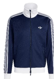
CLASSIC TT (KE3526) 自店販売価格 ¥ 13,200 (税込)