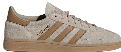
HANDBALL SPEZIAL (IH9762) 自店販売価格 ¥ 15,950 (税込)