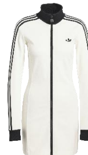
DRESS (KD3771) 自店販売価格 ¥ 14,300 (税込)