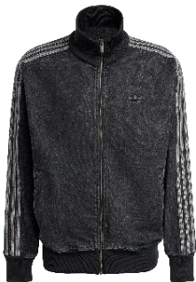
DENIM FB TT (KD1516) 自店販売価格 ¥ 17,600 (税込)