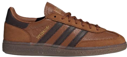
HANDBALL SPEZIAL (IH6569) 自店販売価格 ¥ 16,500 (税込)