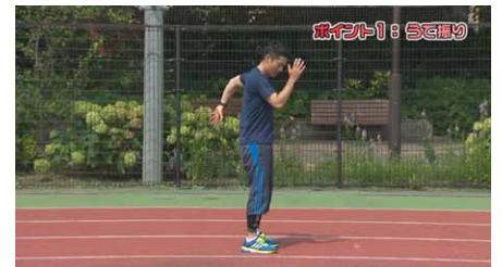
ポイント1 身体の横を払うよう腕を振ると、しっかりと走れるようになる。

運動会のシーズンにあわせて公開する『ライバルをぶっちぎる走り方!』を、ぜひご家族一緒にご覧ください。