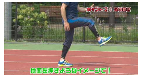
ポイント2 足の動きは、足を高く上げようとせず、地面を上から押すように意識して走るようにする。