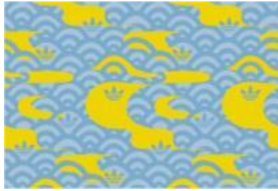
KUMO (CLOUD) / 雲