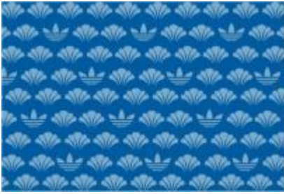
MATSU (PINE) | / 松

ダウンロードサイト: http://shop.adidas.jp/mizxflux/