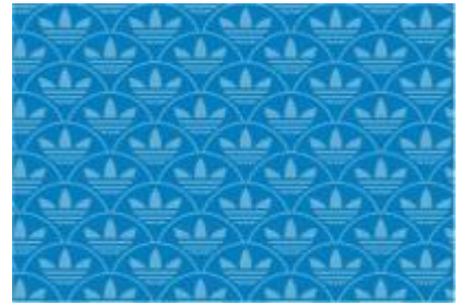
UROKO (SQUAMA) / 鱗