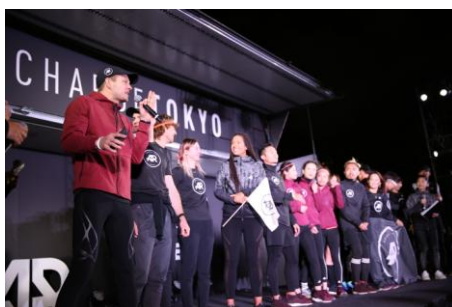
海外のARチームも東京に集結