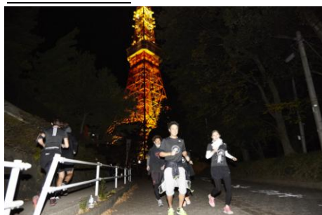
都内を駆け巡るランナー