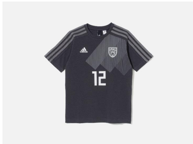
<adidas Young Athletes for White Mountaineering> KIDS 勝色 T シャツ White Mountaineering DW6675 自店販売価格 ¥7,990 +税