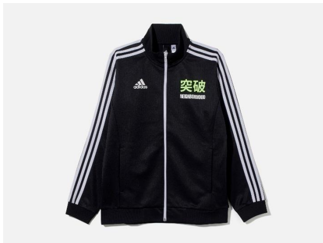
<adidas Athletics for NEIGHBORHOOD> 勝色トラックトップ NEIGHBORHOOD DW6671 自店販売価格 ¥15,000 +税