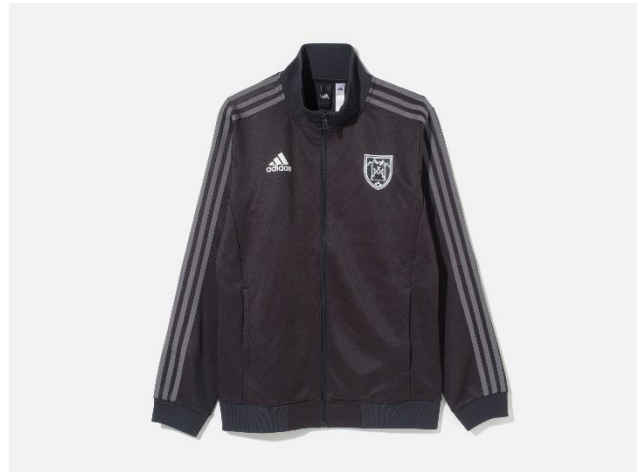
<adidas Athletics for White Mountaineering> 勝色トラックトップ White Mountaineering DW6672 自店販売価格 ¥15,000 +税