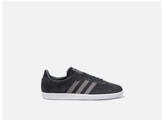
<adidas Originals for White Mountaineering> SAMBA WM F35868 自店販売価格 ¥17,000 +税