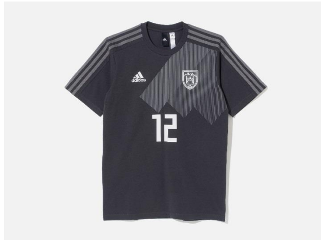
<adidas Athletics for White Mountaineering> 勝色 T シャツ White Mountaineering DW6669 自店販売価格 ¥9,990 +税