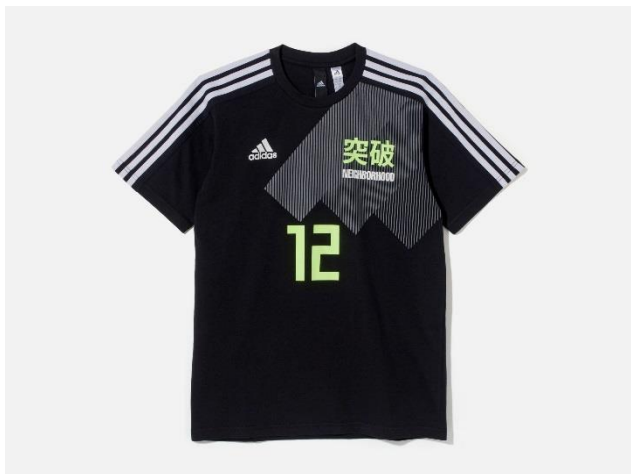
<adidas Athletics for NEIGHBORHOOD> 勝色 T シャツ NEIGHBORHOOD DW6668 自店販売価格 ¥9,990 +税