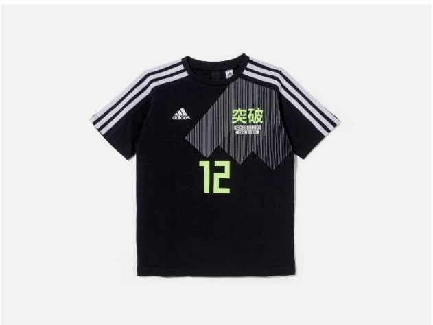
<adidas Young Athletes for NEIGHBORHOOD> KIDS 勝色 T シャツ NEIGHBORHOOD DW6674 自店販売価格 ¥7,990 +税