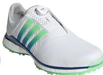
ツアー360 XT-SL ボア 2