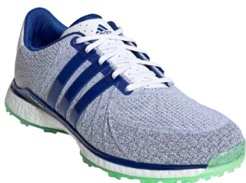
ツアー360 XT-SL テキスタイル

「ツアー360 XT-SL テキスタイル」は、撥水性能のある素材を織ったテキスタイルのアッパーで、シリーズの中で最も快適な仕上がりです。「ツアー360 XT-SL ボア 2」のアッパーは天然皮革より更に硬度の高い人工皮革を採用し、BOA と組み合わせることによって、高次元の安定性とホールド感を確立しています。「ツアー360 XT-SL 2」と「ウィメンズ ツアー360 XT-SL」には天然皮革を採用しており、しなやかさと快適性を両立しています。全てのアッパーのサイドには、素材の質感を維持しながら異素材を使わずに素材硬度を高める新しいフォージド加工を施すことで安定性を向上させながらも、軽量化も実現しながら、ツアーシューズとしてのパフォーマンス性能を担保しています。