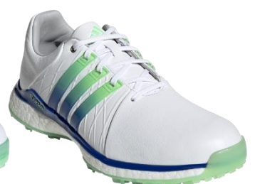
ウィメンズ ツアー360 XT-SL