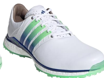
ツアー360 XT-SL 2