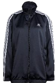
ルーズ サテントラックトップ (IU2516)