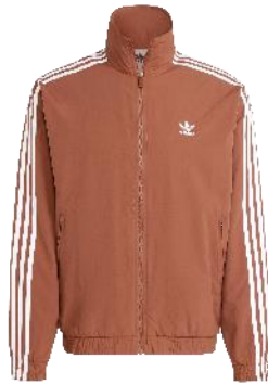
アディカラー ウーブン ファイヤー バードトラックトップ (IZ2424)