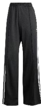
ファイヤーバード ルーズ トラックパンツ