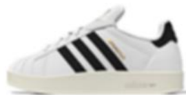
SUPERSTAR HOME W (IE1435)