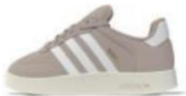
SAMBA HOME W (IH5504)