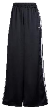
サテンワイドレッグトラックパンツ (IU2520)