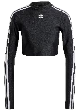
スリーストライプス クロップド 長袖 Tシャツ (IU2428)