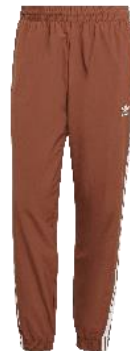
アディカラー ウーブン ファイヤーバードパンツ (IZ2419)