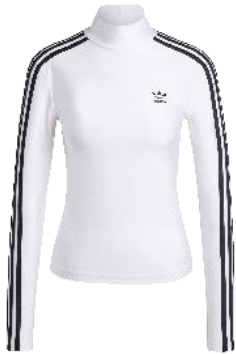
アディカラー スリーストライプス タートルネック長袖Tシャツ (JG1535)