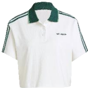
ルーズ クロップ ポロシャツ (IX3555)