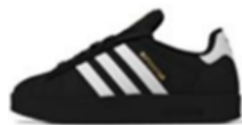
SUPERSTAR HOME W (IH5502)