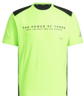
ダブルニット半袖Tシャツ (JM1999)