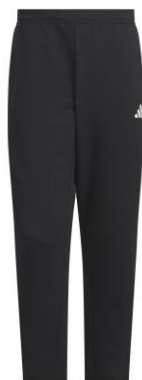
ダブルニットアンクル丈オープンヘムパンツ