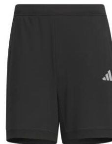
レギュラーフィットダブルニットショーツ