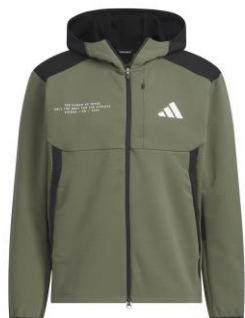
ダブルニットフード付きトラックジャケット