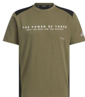
ダブルニット半袖Tシャツ (JM1997)