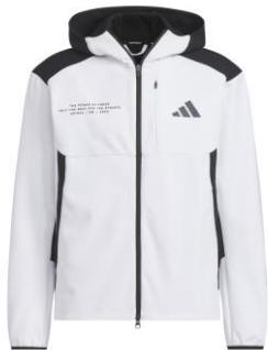
ダブルニットフード付きトラックジャケット