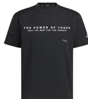
ダブルニット半袖Tシャツ (JM1996)