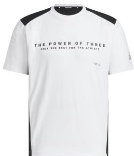
ダブルニット半袖Tシャツ (JM1998)