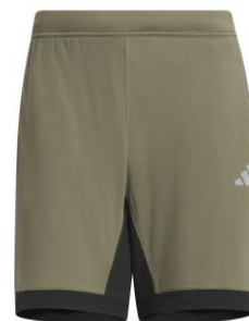
レギュラーフィットダブルニットショーツ