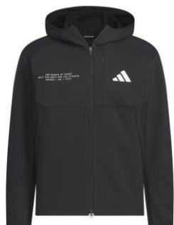
ダブルニットフード付きトラックジャケット