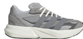
LIGHTBLAZE U (IH8607)