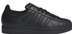
SUPERSTAR II (JI0081) 自店販売価格 ¥ 13,750 (税込) オリジナルのシルエットを復刻した オールブラックのSUPERSTAR