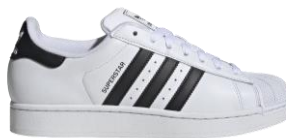
SUPERSTAR II (IH8659) 自店販売価格 ¥ 13,750 (税込) アイコニックなシルエットと共に オリジナルのシルエットを復刻