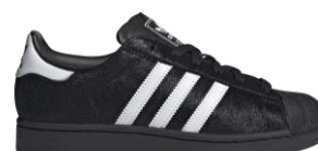
SUPERSTAR II (JH9475) 自店販売価格 ¥ 17,600 (税込) アッパーにプレミアムポニーヘアを あしらった一足