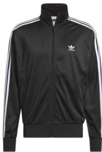
FIREBIRD TT (IJ7058)

自店販売価格 ¥ 13,200 (税込) 袖にスリーストライプスをあしらった、 アディダスのDNAを受け継ぐデザイン