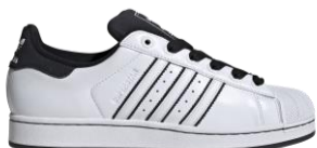
SUPERSTAR II (JH5469) 自店販売価格 ¥ 16,500 (税込) ユニークな配色が印象的な一足。 トレフォイルのロゴが入った シュージュエルが付属する