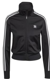
FIREBIRD TT (IL8764)

自店販売価格 ¥ 13,200 (税込) 胸にトレフォイルロゴ、袖にスリー ストライプスをあしらったトラックトップ