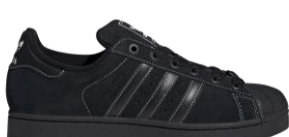
SUPERSTAR II (JH5470) 自店販売価格 ¥ 16,500 (税込) オールブラックのアッパーに白の ステッチが映える一足。トレフォイルの ロゴが入ったシュージュエルが付属する