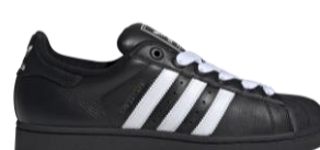
SUPERSTAR II (JI3538) 自店販売価格 ¥ 17,600 (税込) オリジナルとは一味違った特徴的な配色。 トレフォイルのロゴが入った シュージュエルが付属する