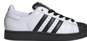
SUPERSTAR II (JI0124) 自店販売価格 ¥ 17,650 (税込) オリジナルのシルエットを再現した ボディに斬新な配色。トレフォイルの ロゴが入ったシュージュエルが付属する