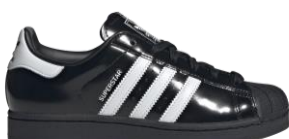
SUPERSTAR II (JH7756) 自店販売価格 ¥ 16,500 (税込) アッパーにパテントレザーを使用した一足