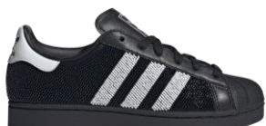
SUPERSTAR II (JH7098) 自店販売価格 ¥ 28,600 (税込) アイコニックなカラーブロッキングを ビーズで再現