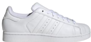
SUPERSTAR II (JI0080) 自店販売価格 ¥ 13,750 (税込) オリジナルのシルエットを復刻した オールホワイトのSUPERSTAR