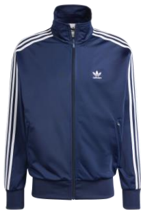
FIREBIRD TT (IR9893)

自店販売価格 ¥ 13,200 (税込) 袖にスリーストライプスをあしらった、 アディダスのDNAを受け継ぐデザイン