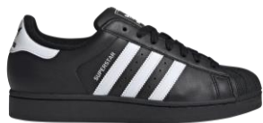
SUPERSTAR II (JI0079) 自店販売価格 ¥ 13,750 (税込) フルレザーアッパーでシュータンと ヒールにはパッド入り