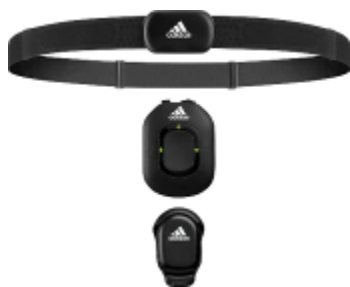
miCoach PACER (マイコーチ ペーサー)

トレーニングメニューを作成する専用ウェブサイト「miCoach.com」と miCoach Pacer(自店販売価格 ¥14,700(税込))、または miCoach CONNECT(自店販売価格 ¥8,400(税込)と無料 miCoach アプリと併用)を連動させることにより、ランナーの運動中の心拍数とペースデータを、設定したトレーニングメニューと照らし合わせ、そのランナーに適切なペースをリアルタイムで音声コーチングします。運動後、「miCoach.com」上にてトレーニングの結果をグラフや地図で確認することや、データを管理することもできます。