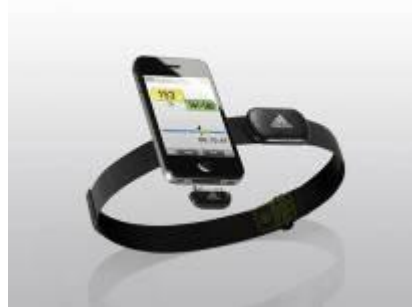
miCoach CONNECT (マイコーチ コネクト)