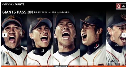
選手インタビューTOP