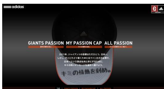
「PASSION CAP キミの情熱を刻め」