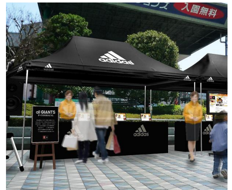
「all GIANTS 119 PASSION CAP」展示イメージ