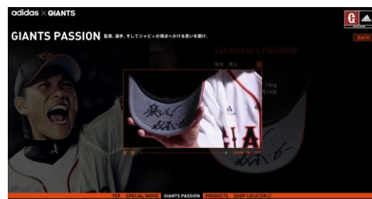
選手インタビュー映像