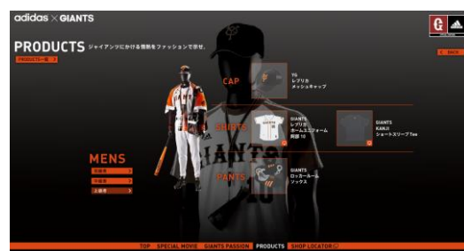
商品コーディネート