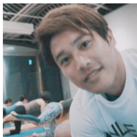
内田篤人 フットボール選手 アディダス契約選手。 YOGA 回で倒れた主人公を励ます。