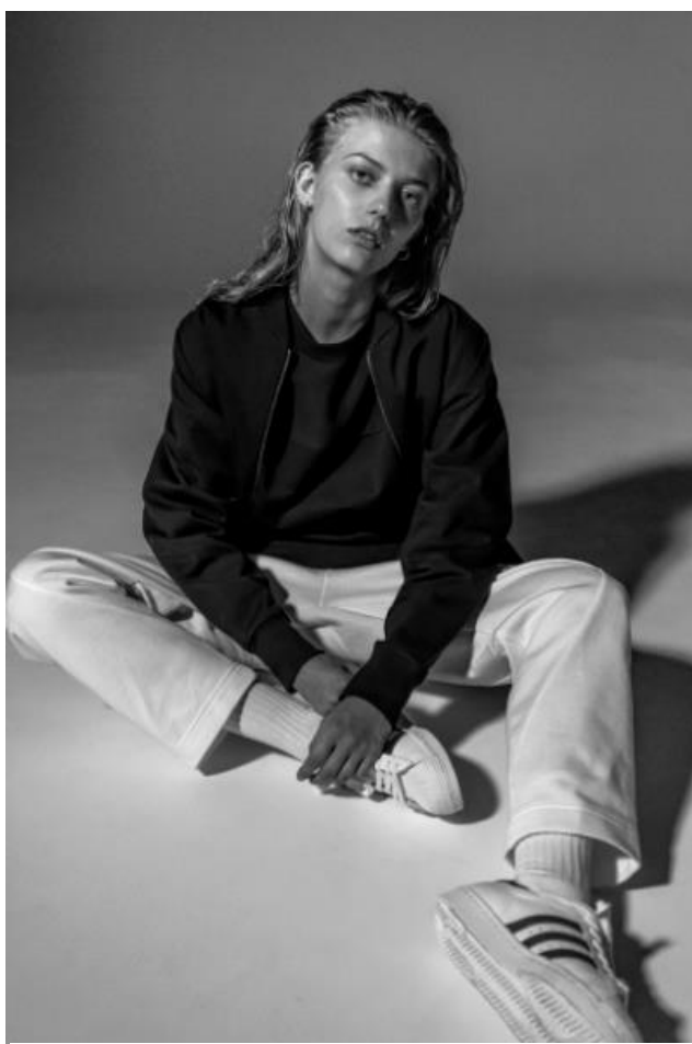
BK2306 TRACKTOP 12,000 円+ 税(自店販売価格) BK2297 TEE 5,490 円+ 税(自店販売価格) BK2289 SWEATPANTS 10,000 円+ 税(自店販売価格)