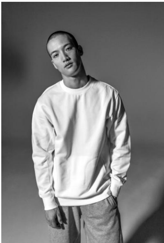
BQ3083 CREW SWEATSHIRT 11,000 円+ 税(自店販売価格) BQ3100 7/8 SWEATPANTS 10,000 円+ 税(自店販売価格)