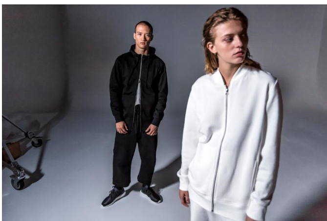
BQ3087 PULLOVER HOODIE 12,000 円+ 税(自店販売価格) BQ3054 SS TEE 5,990 円+ 税(自店販売価格) BQ3103 7/8 SWEATPANTS 10,000 円+ 税(自店販売価格) BK2309 TRACK TOP 12,000 円+ 税(自店販売価格)) BK2289 SWEATPANTS 10,000 円+ 税(自店販売価格)