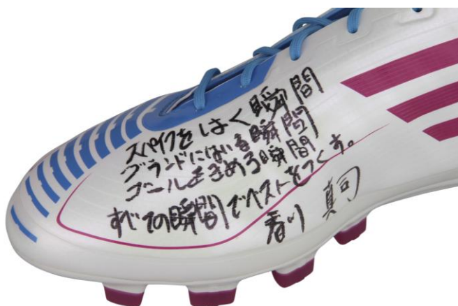
香川真司選手・6月のプレゼント商品(直筆サイン入り)