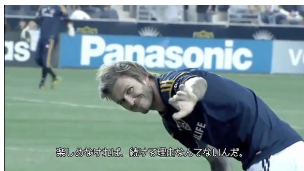
デビッド・ベッカム(プロフットボール選手 ロサンゼルス・ギャラクシー)