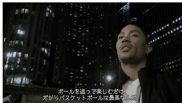
デリック・ローズ(プロバスケットボール選手 シカゴ・ブルズ)