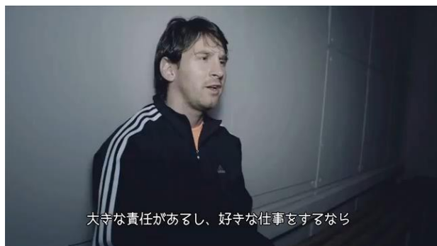
リオネル・メッシ(プロフットボール選手 FC バルセロナ)

2011年6月3日(金)より、新ブランドキャンペーンサイト(adidas.jp)にて、デビッド・ベッカム(プロフットボール選手 ロサンゼルス・ギャラクシー)、リオネル・メッシ(プロフットボール選手 FC バルセロナ)、デリック・ローズ(プロバスケットボール選手 シカゴ・ブルズ)、B.o.B(ヒップホップ アーティスト)、ケイティ・ペリー(シンガー・ソングライター)、ケニー・ビレイ(バイクトライアル)の スペシャルインタビュームービー 「 passion stories アスリートたちの passion を見よ。 」を公開しました。このインタビュームービーでは、各アスリートが自身の情熱ストーリー秘話を語っています。