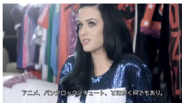
ケイティ・ペリー(シンガー・ソングライター)