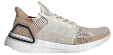
商品番号 : B75878