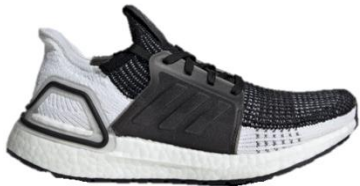
商品番号 : B75879