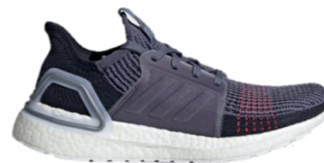
商品番号 : D96863