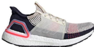
商品番号 : F35284