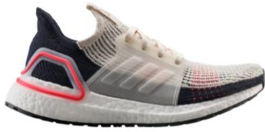
商品番号 : B37705