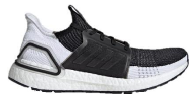
商品番号 : B37704