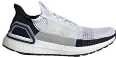
商品番号 : B37707