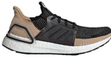
商品番号 : F35241