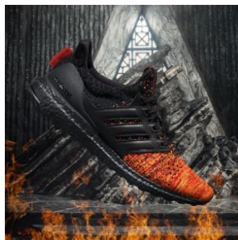
adidas Ultraboost Targaryen (ターガリエン)