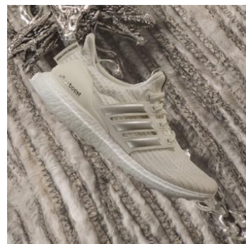
adidas Ultraboost Targaryen (ターガリエン)