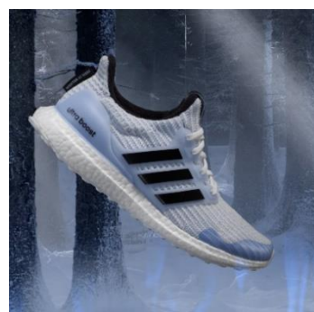
adidas Ultraboost White Walker (ホワイト ウォーカー)