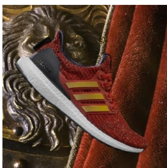
adidas Ultraboost Lannister (ラニスター)