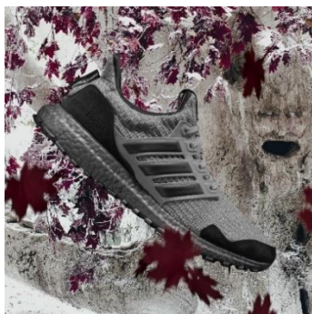
adidas Ultraboost Stark (スターク)