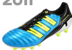
PREDATOR ADIPOWER ブレデターアディパワー