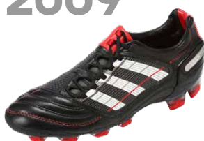
PREDATOR X ブレデターエックス