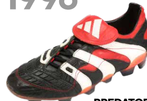
PREDATOR ACCELERATOR ブレデターアクセラレーター