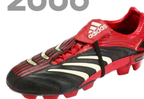
PREDATOR ABSOLUTE ブレデターアブソリュート