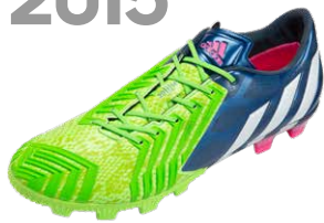
PREDATOR INSTINCT ブレデターインスティンクト