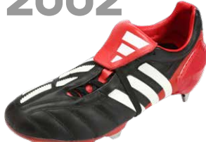
PREDATOR MANIA ブレデターマニア