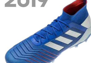
PREDATOR 19 ブレデター19

初代ブレデターの誕生は1994年。特徴的なつま先のフィン、ボールコントロール性とシュートの威力を高めるために開発されたテクノロジーで、のちにブレデターの代名詞ともなる鋭いカーブのついたシュートを生み出すことができた。歴代ブレデターは、常に斬新なデザインと先進のテクノロジーでピッチに君臨し、進化し続ける優れたボールコントロール性により、トッププレーヤーのクリエイティブなプレーを支えてきた。