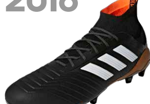
PREDATOR 18 ブレデター18