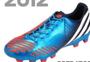
PREDATOR LETHAL ZONES ブレデターリーサルゾーン