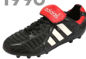
PREDATOR TOUCH ブレデタータッチ