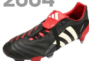
PREDATOR PULSE ブレデターパルス