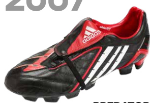
PREDATOR POWERSWERVE ブレデターパワースワープ