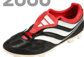
PREDATOR PRECISION ブレデタープレジジョン