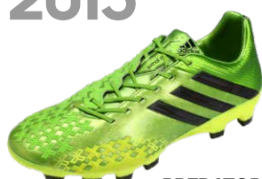
PREDATOR LETHAL ZONES ブレデターリーサルゾーン