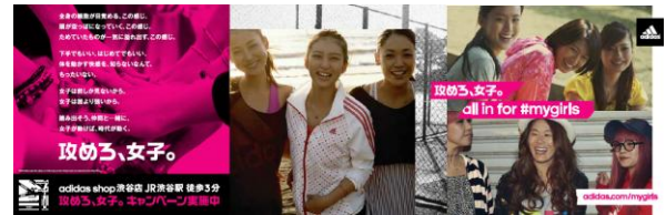
武井/澤/浅尾パターン