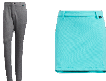
EX STRETCH ACTIVE ポンチパンツ(メンズ) フロントスリット ポンチスカート(ウィメンズ)

ソフトな風合いのレーヨン混のポンチ素材のパンツとスカート。伸縮性に優れた張り感のある素材のため、動きやすくシルエットをキープしやすい素材です。後身頃のロゴ刺繍がデザインアクセントとなっています。※スカートはインナーパンツ一体型 【ストレッチ 吸汗速乾】