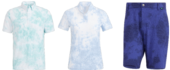
スプレーダイ半袖シャツ(メンズ・ウィメンズ) / ショートパンツ(メンズ)

スプレー加工で染めたタイダイ柄風のプリントを全面に施し、肌離れの優れたサッカー素材の半袖シャツ。メンズはショートパンツも。ゴルフコースからインスピレーションを受けた自然な色使いが特徴です。これからの暑い季節に活躍する便利なアイテムです。※製品の柄の出方は商品毎に異なります。 【ストレッチ 吸汗速乾】