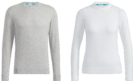
長袖クルーネックセーター(メンズ・ウィメンズ)

軽量の薄手コットンブレンドのセーター。ミニマムなデザインの中に、左袖の大きなジャガード編みのアディダスロゴがアクセントとなっています。