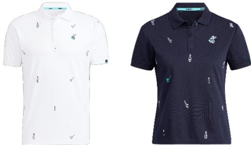
モノグラム半袖ポロシャツ(メンズ・ウィメンズ)

ゴルフとサステナブルにまつわるモチーフを全体に刺繍した鹿の子素材の半袖ポロシャツ。胸のプルカートエンブレムが PLAY GREEN コレクションのアイコンとなっています。 【吸汗速乾】