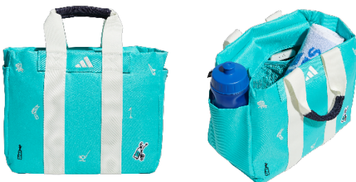
モノグラム ラウンドトートバッグ

ゴルフとサステナビリティに由来するアイテムをモノグラム柄に落とし込んだラウンドトートバッグ。カラーリングは空や海、ゴルフコースからインスパイアされたネイビーやグリーンを採用しています。内側にはメッシュポケット、サイドには出し入れしやすいオープンポケットを装備。背面には貴重品を入れられるファスナー付きの隠しポケットを備えています。