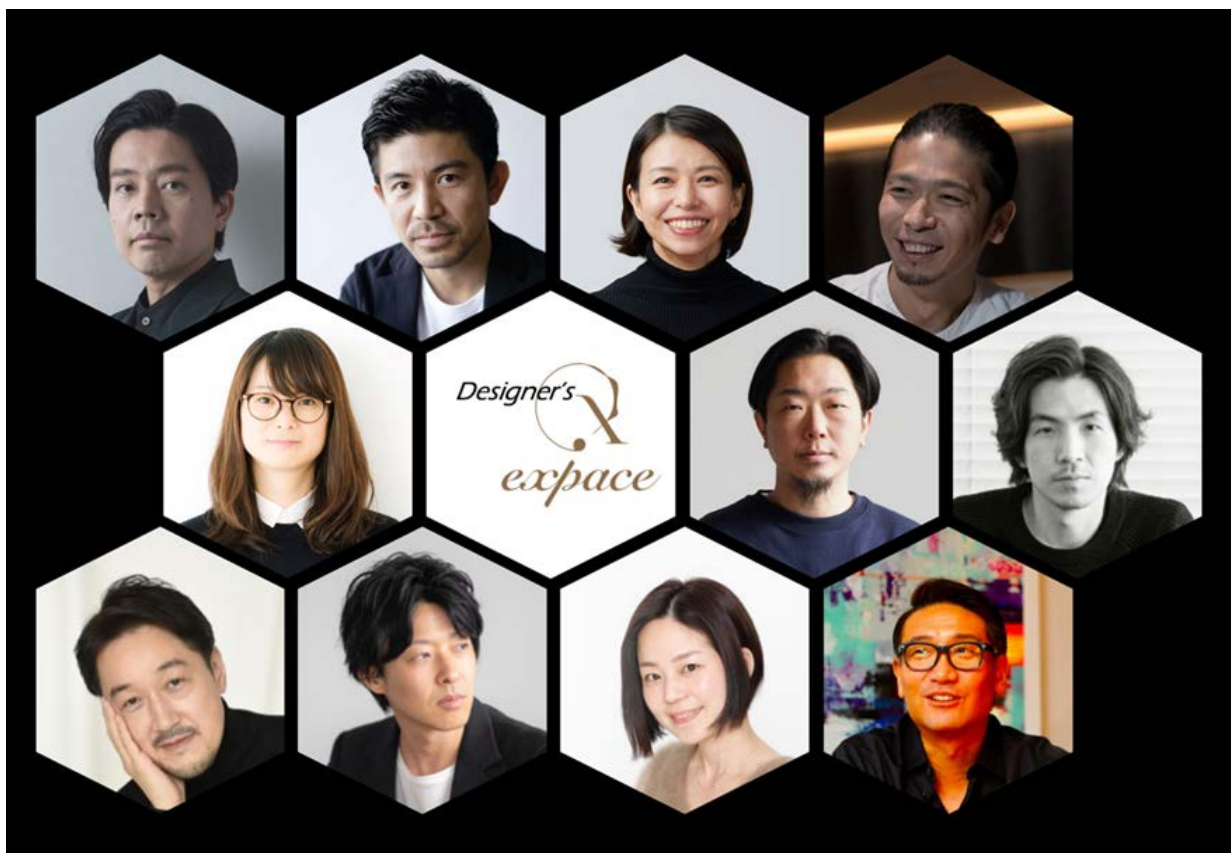
「Designer's expace」に参加している空間デザイナー

「Designer's expace」は、これから新しい空間づくりを検討される事業主のニーズに応えるため、凸版印刷が半世紀以上提供してきた建装材デザインとメディア掲載や受賞歴のある気鋭の空間デザイナーが共創することで独自性のあるアイデアによる空間づくりをサポートする体制を整えました。また、こだわりの空間デザインを具現化する際に、事業主とデザイナーのコミュニケーションを円滑に行うプラットフォームを構築し、空間の企画コンセプト・デザインから設計、施工までをワンストップで提供可能です。今後、共創するデザイナーの参加数を増やし、こだわりの空間デザインの選択肢を広げます。