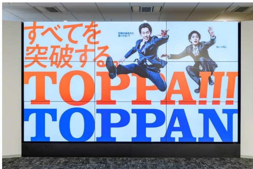
「180 インチマルチディスプレイ」

4K に対応した大型ディスプレイを常設しています。オンラインイベントやプレゼンテーション、ウェビナーの開催、新商品発表会など、使用用途は多岐にわたります。