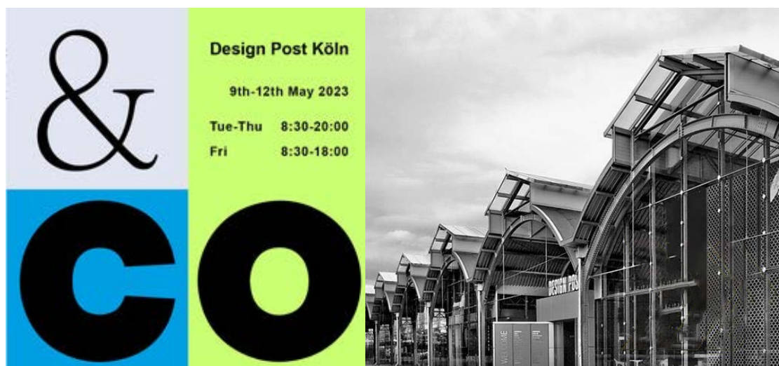
「&CO」キービジュアルと会場写真

凸版印刷は建装材事業において、グローバル市場を見据えて世界各地の品質要件・環境ニーズに合わせた製品の企画・開発を推進しています。本展示会では、コラボレーション、コネクション、コクリエーション等「ともに」を意味する言葉から創られた「&CO」をコンセプトに、家具・インテリア業界向けの最新の建装材・化粧シートを展示します。さらにサステナブルな社会の実現につながる環境配慮製品や、未来につながるデジタルテクノロジーを提案します。