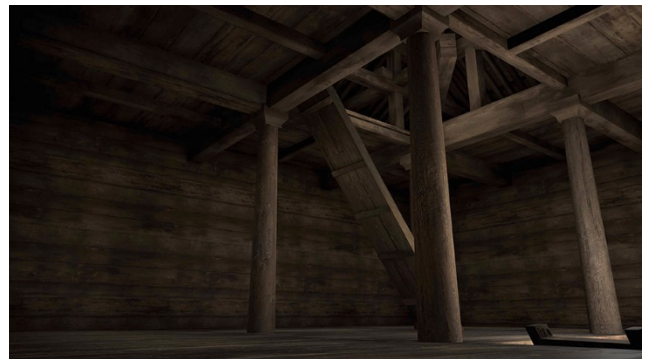
(左)「正倉」の構造と(右)VR 正倉内部。総檜造りの質感までわかる。