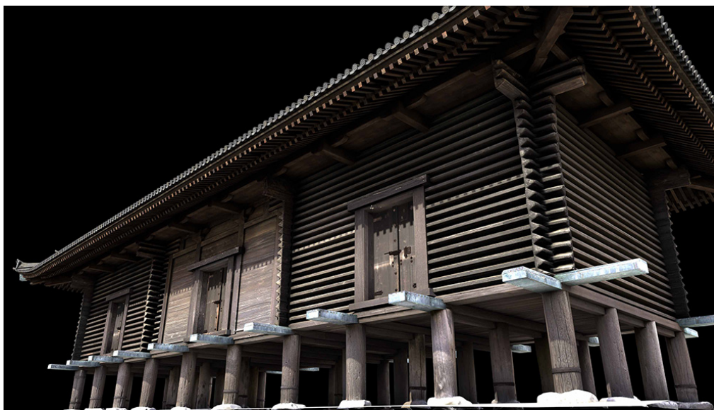
VR 作品『正倉院 時を超える想い』

TOPPAN ホールディングスのグループ会社である TOPPAN 株式会社(本社:東京都文京区、代表取締役社長:齊藤 昌典、以下 TOPPAN)は、奈良国立博物館で開催される「第 75 回正倉院展」(10 月 28 日-11 月 13 日)関連イベントとして、11 月 2 日(木)・3 日(金・祝)の 2 日間(各日 4 回)、VR 作品『正倉院 時を超える想い』の特別上演会を実施、10 月 5 日(木)から観覧券の販売を開始します。