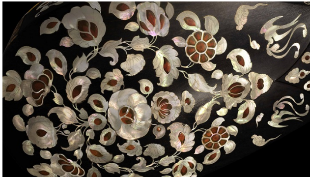
表面に施された緻密な装飾