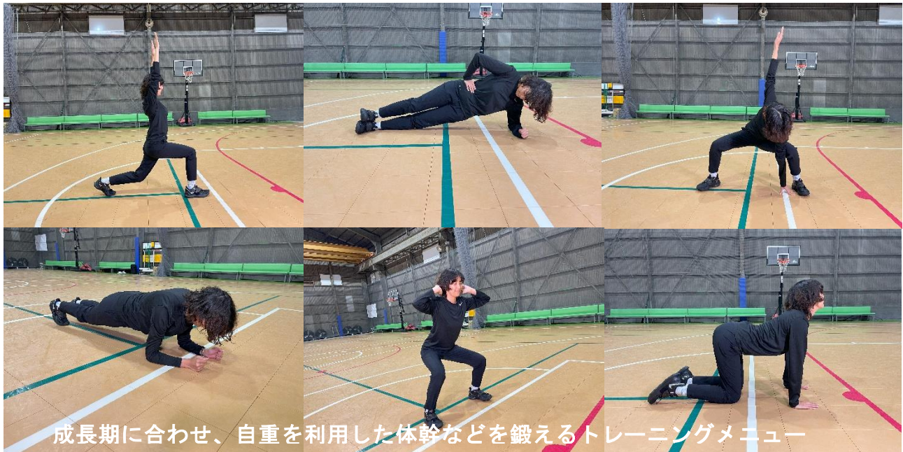
「Loop Training System for 部活」基礎トレーニングメニュー一例

森永製菓株式会社(本社:東京都港区芝、代表取締役社長:太田 栄二郎)が運営するアスリート向けトレーニング施設「森永製菓intトレーニングラボ」(※1)が、成長期である中学生などに合わせたトレーニングメニューを監修。例えば、ウェイトなどの器具を使わずに自重を利用したメニューを実施することで、怪我のリスクを抑えながら、最適なトレーニングをすることが可能です。また、ウォームアップからクールダウンまでの部活動で重要な基礎体力向上を図るメニューはもちろん、平日、休日、雨の日など部活動における様々なシチュエーション別のメニューにより、生徒自身で主体的に部活動を行うことができます。