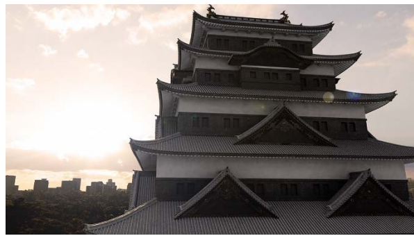
(左上) 細部まで作りこんだ鯨 (右上) 考証を元に屋根の意匠と金具を再現 (左下) 図面に基づく構造再現 (右下) 現存した場合を想定した天守の姿 VR 作品『江戸城の天守』より 監修:東京国立博物館 制作:TOPPAN 株式会社