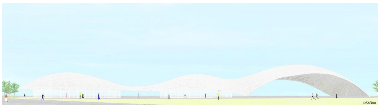
大屋根施設

* 本ニュースリリースに記載された商品・サービス名は各社の商標または登録商標です。