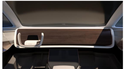
「ダブルビュー®フィルム」の車載用モックアップのイメージ

「ダブルビュー®フィルム」は、TOPPAN が建装材事業で培ってきた木目等の表現方法を進化させた透過加飾技術を使用した化粧シートです。この特殊な化粧シート「ダブルビュー®フィルム」によってディスプレイの存在を隠しながら、従来同様のコンテンツ表示を可能にしました。本展示会では、車載向けに「ダブルビュー®フィルム」を用いたモックアップを展示します。情報を表示するディスプレイと内装パネルをシームレスに一体化することで、移動空間に美しさと新しい価値観を提供します。