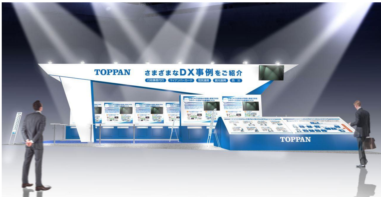
TOPPAN/TOPPAN エッジ ブースイメージ

また、西1ホール特設会場において、2022年12月にTOPPANと行政DXの連携協定を締結した世田谷区の担当者を交えて、「自治体職員が不足する未来に、企画総務部門・所管部門・民間が連携して行政改革に取り組むためには」をテーマとしたセミナーを実施します。