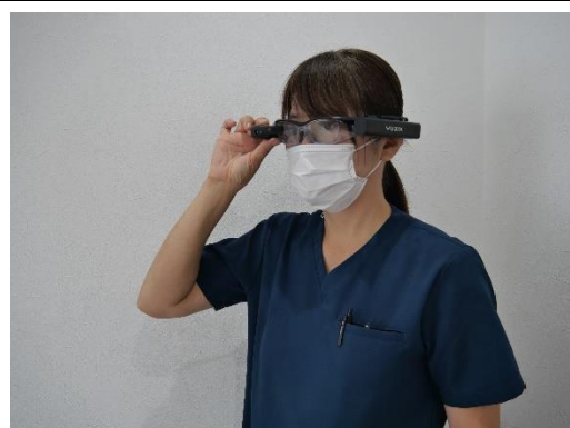
訪問看護での「RemoPick ® 」活用イメージ