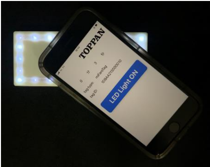
LED 付き NFC タグ

LED 付き NFC タグにスマートフォンをかざすと LED ライトが点灯します。本製品はコンパクトのミラー部分や化粧箱等、容器に直接組み込むことが可能で消費者がスマートフォンをかざすと LED が点灯します。容器に高級感を与えるだけでなく、消費者に新しい体験を提供することで、他ブランドとの差別化に繋がります。