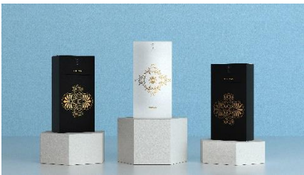
NFC 機能内蔵型スマートパッケージ © TOPPAN Digital Inc.

NFC タグを紙器構造に組み込むことで、パッケージの意匠性を保持しつつセキュリティ性を強化することができます。開封検知機能付きの NFC タグを使用すると、パッケージの開封・未開封を消費者へ伝えることが可能です。また、製品購入者限定の情報配信や特典の配布等、新しい顧客接点構築ツールとしても使用することが可能です。