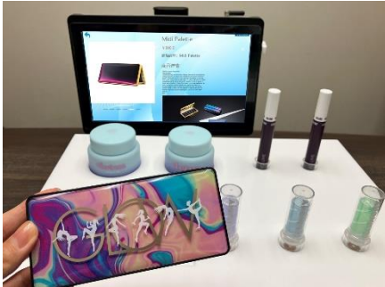
スマートシェルフ

専用の什器に置かれた NFC タグ付きの製品を手にとるとスクリーンに動画が流れ、ブランドの世界観やストーリーを消費者に体験してもらうことができます。動画に商品情報を載せると、商品の詳細を即座に顧客に伝えられるため、店頭説明業務の省人化に繋がります。顧客が製品を手にとった回数をデータとして記録することができるため、顧客が手にとる頻度の高い製品に向けた施策を打ち出すことが可能になります。