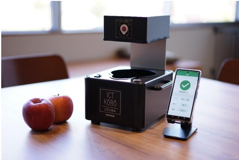
りんご向けコンパクト選果機

今後 TOPPAN デジタルは、飯綱町りんご農家の意見をもとに本選果機の使い勝手や精度向上の改良を行い、2026年下半期までの提供開始を目指します。