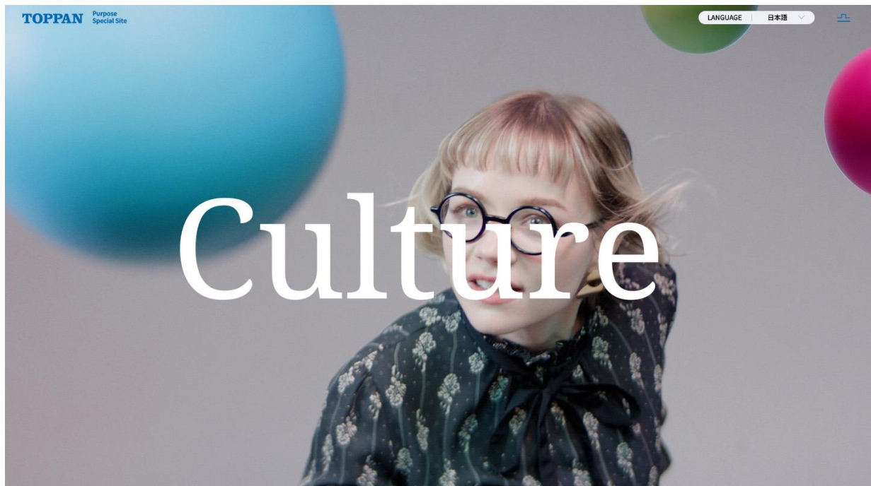
「TOPPAN's Purpose Special Site」より