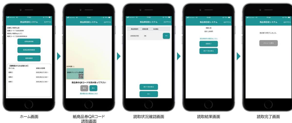
加盟店向け消込用アプリ 操作イメージ

紙商品券に印字された QR コードを、加盟店向けに提供する消込用アプリ/WEB で読み取り、自店舗で読み取り処理(消込)を行った紙商品券を精算データとして集計します。画面 UI も店員が直感的に使用しやすいよう、シンプルなつくりになっています。また消込用アプリは、ネイティブアプリと WEB ブラウザの両方に対応することで、加盟店が利用しやすい環境を選択できるようにしています。