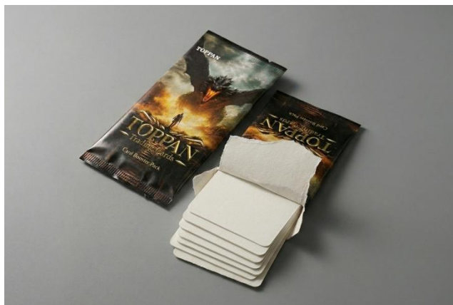
紙製ピロー包材のイメージ

2026年秋より安定した量産を開始し、グローバルに加速する環境負荷低減の取り組みに貢献します。