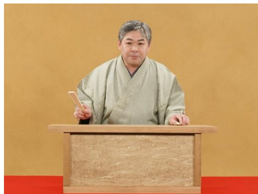
「イオンモール VR×講談」